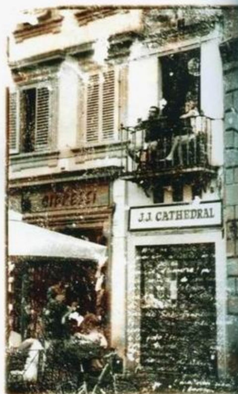
Из проекта «Scrittura Italiana». 2003–2004.