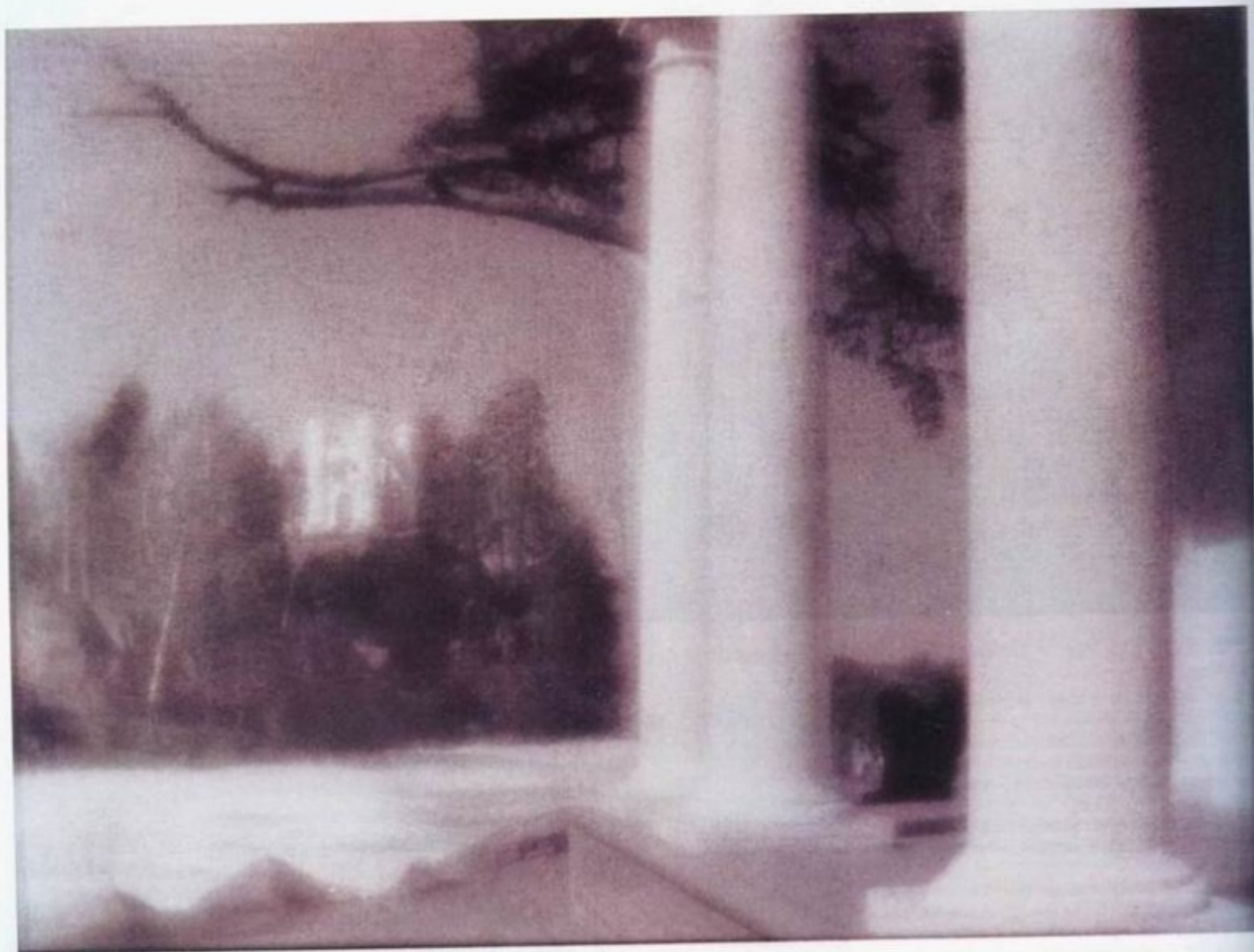
Из серии «Монрепо». 2002.

В октябре в Центре современного искусства М'Арс завершилась выставка «Петербургская школа. Серебряная фотография», включившая более 200 работ современных авторов. Это самая масштабная экспозиция петербургской чёрно-белой ручной фотографии наших дней из всех, что были представлены за последние годы в Москве.