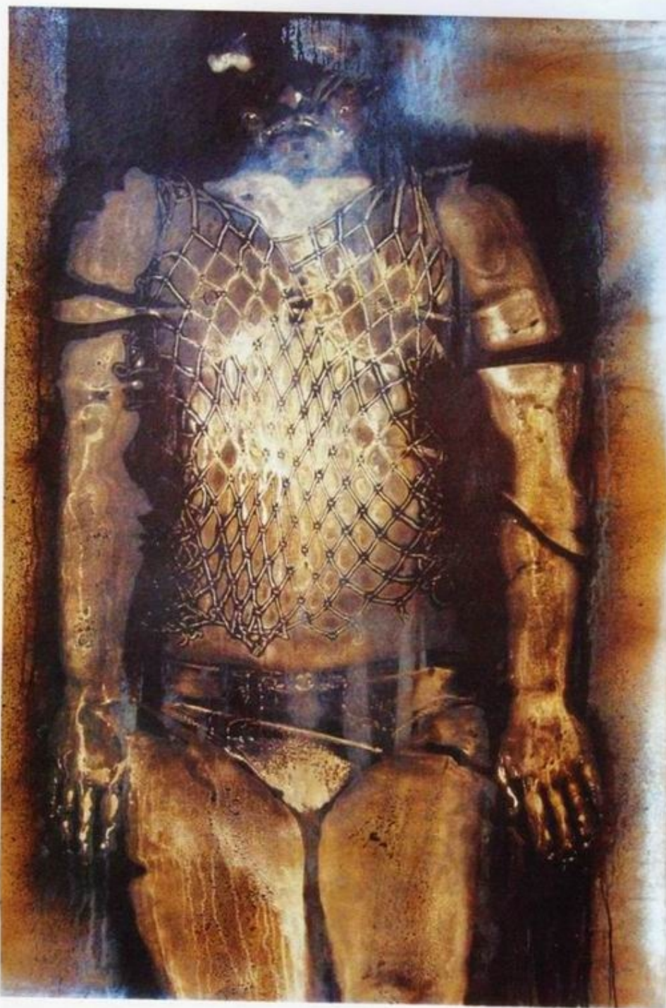
Из серии «Следы человека». 2005.