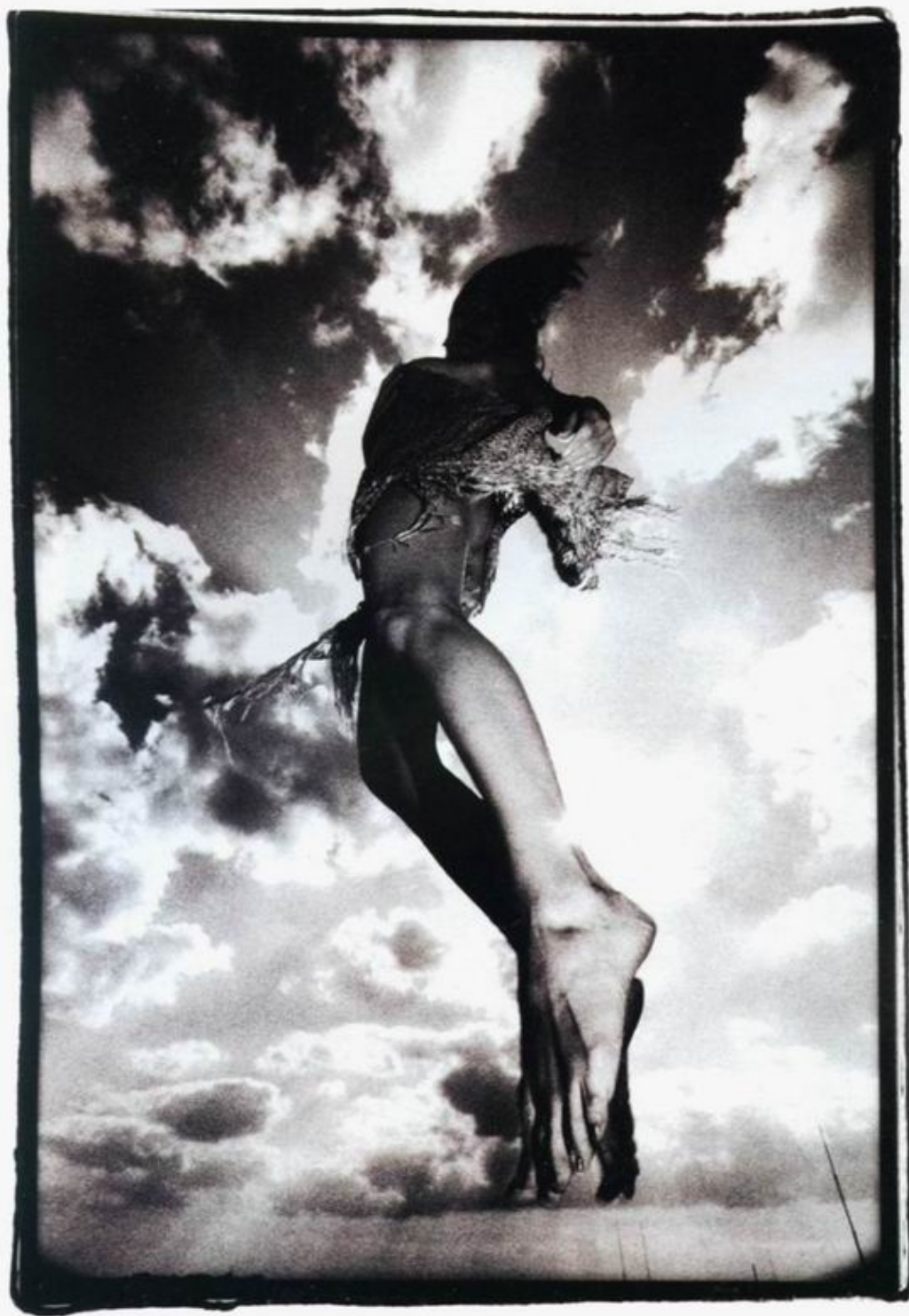
Из серии «Без названия». 2005.