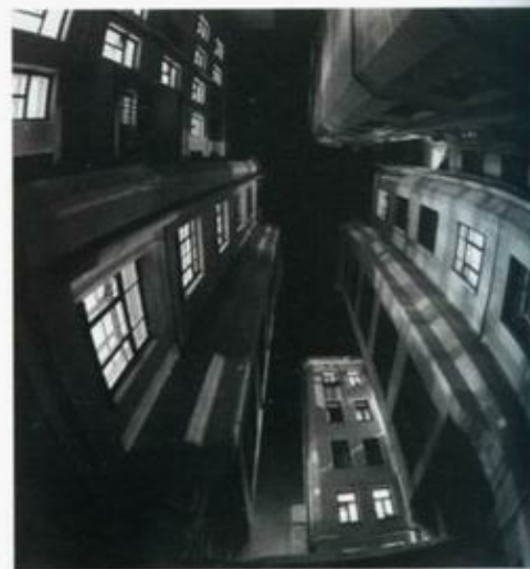
«Ночные узоры». 2000.