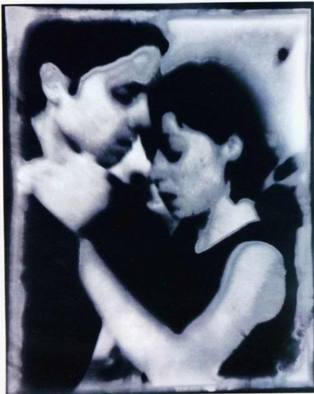
Из серии «Танец». 2004.

Современный Санкт-Петербург богат фотографическими событиями — бесчисленные выставки и конкурсы, ставший традиционным фестиваль «Осенний фотомарафон», проекты Арт-центра «Пушкинская-10», работа секции фото-