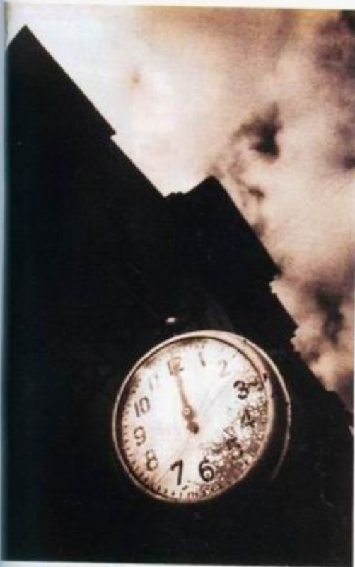
«Коломна». 1970–2001.